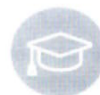
Animateurs et ATS formés et qualifiés

Evaluation / indicateurs proposés au regard des objectifs ci-dessus (par exemple, nombre de d'adhérents, équilibre budgétaire, mobilisation de bénévoles, etc.) :