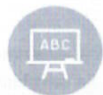
Écoles publiques maternelles de Lomme