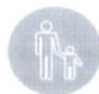
Projet éducatif défini en fonction des besoins de l'enfant