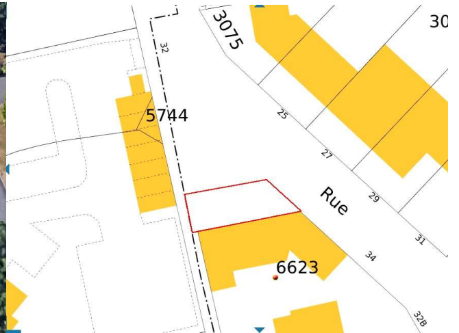
Emprise à déclasser pour accès privés