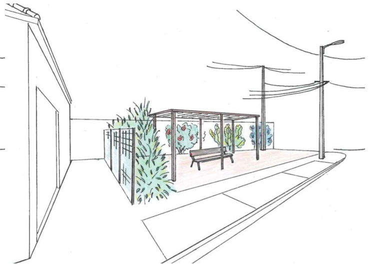
Esquisses d'aménagement paysager du site