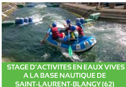
STAGE D'ACTIVITES EN EAUX VIVES A LA BASE NAUTIQUE DE SAINT-LAURENT-BLANGY (62)

Description : Un lieu de vie grandeur nature pour vivre des aventures ludiques et pédagogique, avec au programme : équitation, poney, tir-à-l'arc, conception d'attrapes-rêves... et des nuitées en tipi pour se croire au pays des indiens !