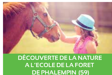
DÉCOUVERTE DE LA NATURE A L'ÉCOLE DE LA FORET DE PHALEMPIN (59)

Description : Des activités pour se dépenser et découvrir le rafting et le kayak, pratiquer le VTT, s'essayer au tir-à-l'arc et à l'orientation et faire le plein de sensations ! Sous condition de réussite du test d'aisance à la piscine municipale (gratuit). Nuitées sous tente.