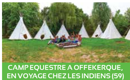
CAMP EQUESTRE A OFFEKERQUE, EN VOYAGE CHEZ LES INDIENS (59)

Trois mini-séjours dans la région avec des thématiques variées pour s'évader et gagner un peu plus en autonomie, et bien évidemment s'amuser sous le regard bienveillant d'une équipe d'animation qualifiée !